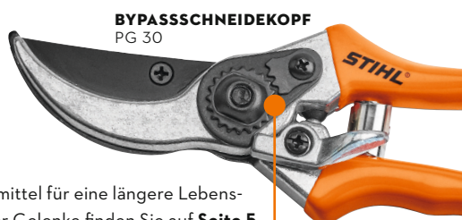
BYPASSSCHNEIDEKOPF PG 30

Der Bypass-Schneidekopf besteht aus zwei Klingen, die eine präzise und saubere Schnittführung bieten. Dieser ergonomisch angewinkelte Schneidekopf ist für eine Verwendung an Sträuchern und Stauden mit dünnen Trieben bis zu einer Stärke von 2 bis 2,5 cm gut geeignet.