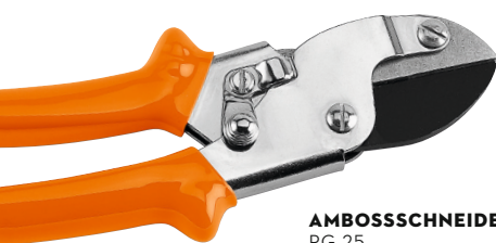
AMBOSSSCHNEIDEKOPF PG 25

Der Amboss-Schneidekopf ist gut geeignet für hartes und abgestorbenes Gehölz. Man benötigt einen geringen Kraftaufwand, um selbst dickere Äste zu zerschneiden. Die Amboss-Schere arbeitet mit lediglich einer scharfen Schneide, die austauschbar ist und so eine lange Lebensdauer ermöglicht.