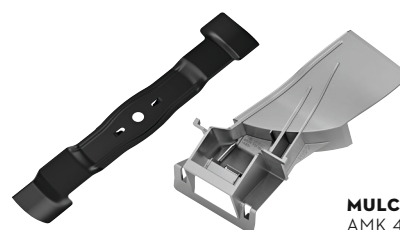
MULCH-KIT AMK 448

Das nachrüstbare Mulch-Kit für STIHL Rasenmäher zerkleinert das Gras beim Mähen in feine Graspartikel. So kann der feine Grünschnitt als nährstoffreicher Dünger in die Grasnarbe zurückfallen. Das Zubehörset ist für verschiedene STIHL Rasenmäher-Modelle erhältlich und besteht aus einem Multi-Messer und einem Mulcheinsatz.